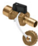
Robinet de remplissage et de vidange à bille avec poignée noire