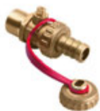
Robinet de remplissage et de vidange à bille type volant-bonnet