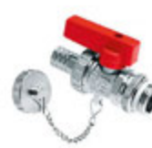
Robinet de remplissage et de vidange à bille avec poignée rouge auto-étanchant laiton nickelé