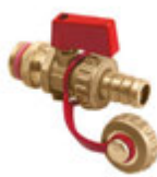
Robinet de remplissage et de vidange à bille avec poignée rouge auto-étanchant